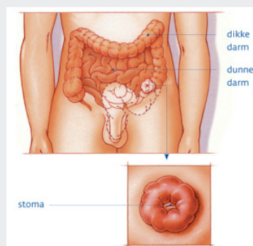
Figuur 3. Een stoma op de dikke darm

Soms is het niet mogelijk beiden delen van de darm weer met elkaar te verbinden. Dan wordt er een stoma op de dikke darm aangelegd (colostoma), zie figuur 3. Dit kan een tijdelijk of een blijvend stoma zijn.